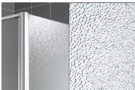
ESG strukturované SR Arena C