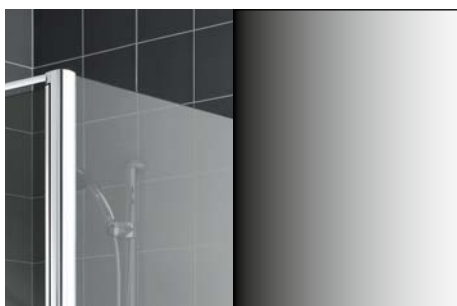
ESG barevné šedě tónované