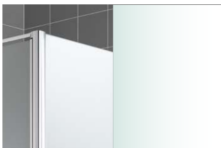
ESG mléčné SR Opaco