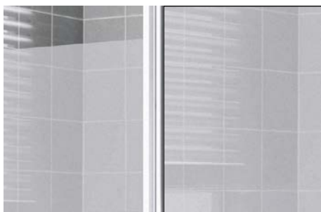
ESG Serigrafie Cada XS