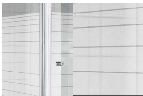
ESG Seriegrafie Atea 2011